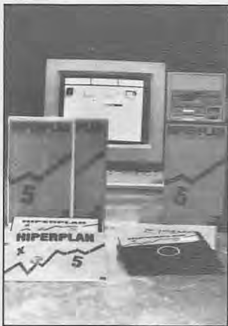
HIPERPLAN, NOVA ESTRATÉGIA DE VENDA

O programa imprime 13 tipos de relatórios e dispõe ainda de calculadora, agenda de endereços, e calendário com agenda de compromissos.