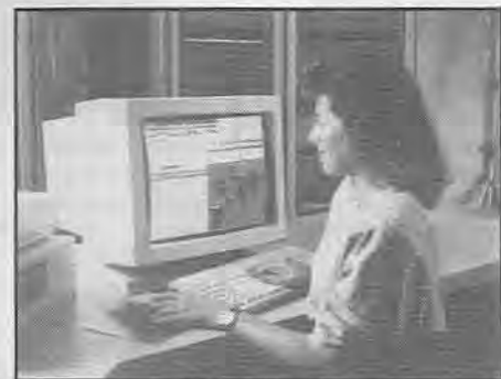
MULTIPLEXADOR OMNIMUX 9000

No caso de comunicação de imagem, a empresa pode realizar teleconferências internacionais, ligando todos os locais em que se localizam seus escritórios. Além disso, monta uma rede privada de comunicações, pendurando neste único canal de 2 Mbits, uma ligação privativa de voz, fax, dados e imagem. Com isso, o usuário tem uma sensível redução de custo pela eliminação dos interurbanos e congestionamentos de troncos.