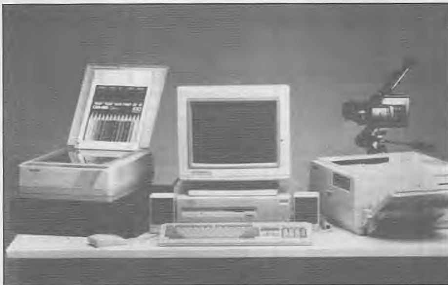
AMIGA 3000 NO BRASIL